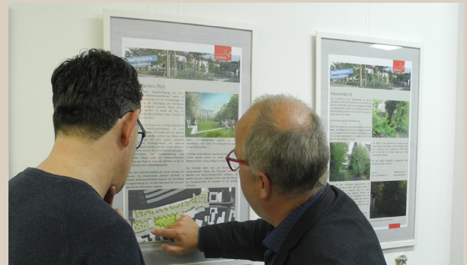
Tag der offenen Tür im Quartiersbüro

Das Quartiersmanagement hat sich am 13.10.2017 gemeinsam mit dem Quartiersmanagement Galgenhof/Steinbühl am Tag der offenen Tür der Stadt Nürnberg beteiligt. Es wurde über aktuelle Projekte und Aktionen informiert und interessierte Kinder konnten passend zum Thema „Mehr Grün für Nürnberg“ Tontöpfe bemalen und mit Bio-Kräuter bepflanzen.