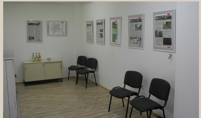
Gruppenraum des Quartiersbüros

Das Quartiersmanagement steht Ihnen bei Fragen zur Förderung gerne zur Seite!