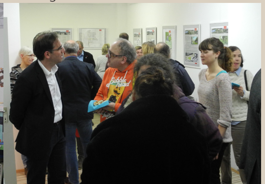
Impressionen des Neujahrsempfang 2018