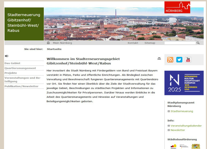
Homepage des Quartiersmanagements - Screenshot

Sie haben daneben auch die Möglichkeit sich über ein Kontaktformular direkt an das Quartiersmanagement zu wenden und Ihre Fragen und Anregungen weiterzugeben.